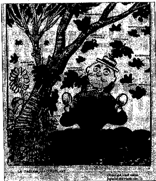
Figura 1. Un señor, sentado en una seta, contempla las hojas caer. Algunos de los mensajes que contienen las hojas son: «empleados hipócritas», «ministros ladrones», «justicia podrida», «pornografía», «constitución», «diputaciones nulas», entre otros. L'Esquella de la Torratxa , 05/11/1923.

Al mismo tiempo, ante la percepción de que el funcionamiento del aparato administrativo daba muestras de disfunción, Primo de Rivera, el cirujano de Hierro , pretendía poner fin, con políticas regeneracionistas ancladas en las ideas de Joaquín Costa, a los problemas enquistados durante la Restauración, como la corrupción y el caciquismo, interviniendo el Estado y estimulando el relanzamiento del sistema para cuando éste estuviera saneado. Así, uno de los objetivos trazados por el militar andaluz era la consecución de la paz social por la vía de eliminar de raíz los conflictos sociales presentes en España mediante la labor de distintos organismos de conciliación y arbitraje, especialmente en el marco de las relaciones laborales.