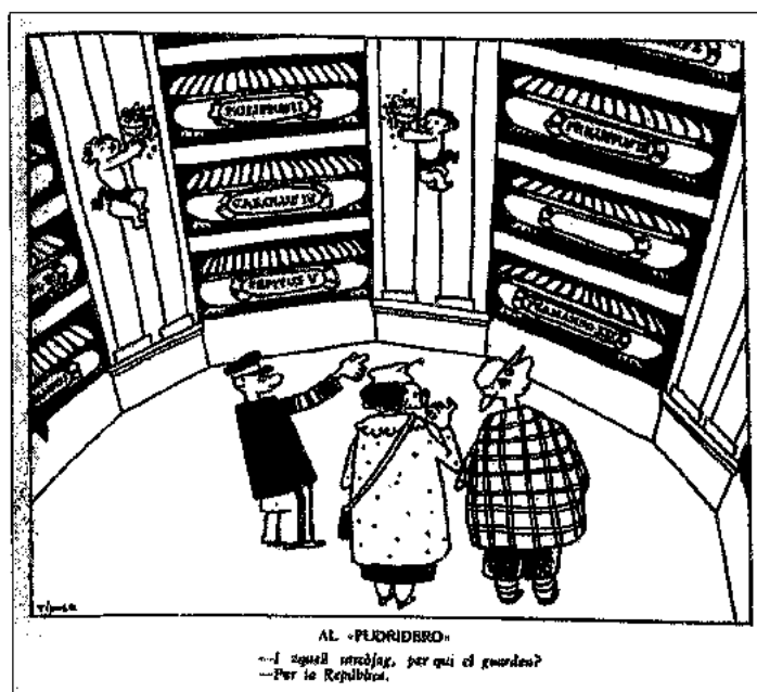
Figura 6. «En el «pudridero». — ¿Y aquel sarcófago para quién lo guardan? — Para la República». El Bé Negre , 25/04/1934.