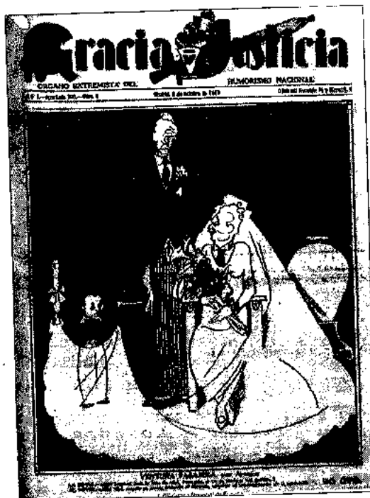
Figura 9. Portada con una caricatura de Francesc Macià (el novio) y Manuel Azana (la novia). —La novia: ¡Qué hermosa sería la luna de miel, Paco mío, si no acabara tan pronto...!— El novio: ¡Oh! Miri, cuando se acabe, teniendo el divorcio, empieza el entretenimiento de la separación. Gracia y Justicia , 03/10/1931

esto puede encontrarse en las continuas caracterizaciones del conservador y católico presidente Niceto Alcalá-Zamora, presentado con marcados rasgos femeninos. O incluso como la prometida de Francesc Macià, que suspiraba por una larga luna de miel con la Generalitat. La imagen de este último, además, llegó a ser presentada con la piel de color negro, en clave inequívocamente racista.