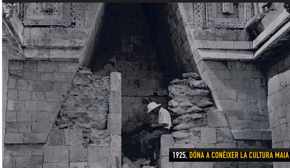
1925. DÓNA A CONÈIXER LA CULTURA MAIA