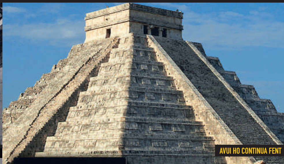
AVUI HO CONTINUA FENT